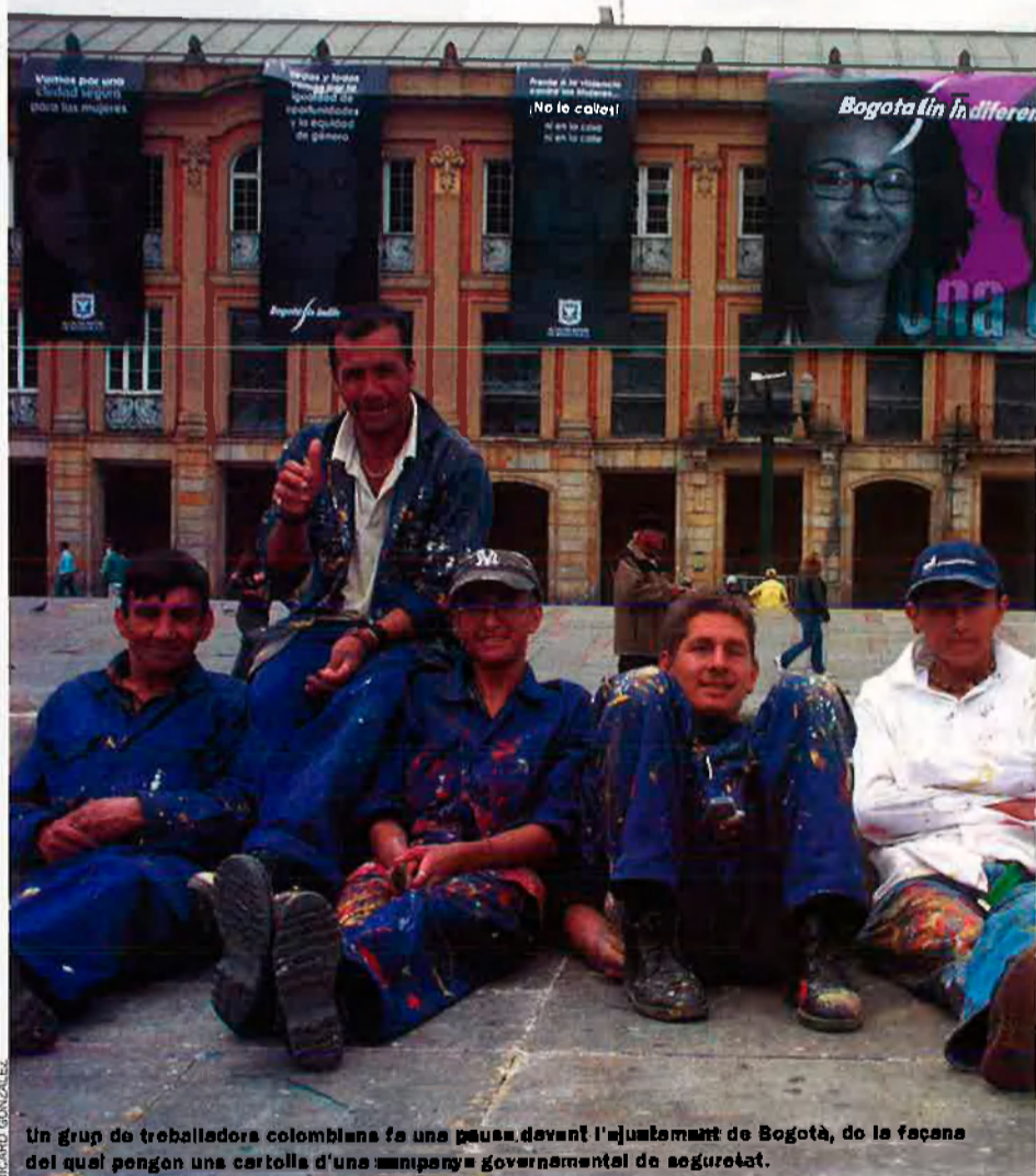
Un grup de treballadors colombians fa una pausa davant l'ajuntament de Bogotá, de la façana del qual pengen una cartolla d'una amniparxa governamental de seguretat.

Gairebé un any després de ser reelegit, el colombià Álvaro Uribe, l'únic president conservador d'Amèrica del Sud, manté intacta la seva popularitat. Tanmateix, l'inici d'una investigació judicial sobre una suposada vinculació de diversos grups paramilitars amb el Govern, una situació denunciada per l'oposició d'esquerra, podria començar a passar-li factura.