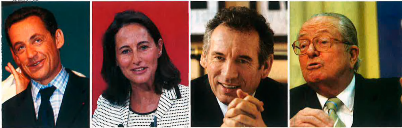
Els quatre candidats amb més possibilitats, Nicolas Sarkozy, Ségolène Royal, François Bayrou i Jean-Marie Le Pen.

de no tenir un corrent propi, ja que els vençuts ressentits de les primàries socialistes, Dominique Strauss Kahn, Laurent Fabius i Lionel Jospin, no paren de fer-li travetes. Mentrestant, Royal ha mancat de claredat a l'hora de presentar el seu programa i ha comès alguns errors de debutant. En qualsevol cas Royal també topa amb el fet de tenir els mitjans de comunicació en contra i ser menysvalorada pel microcosmos parisenc, és a dir, aquells que donen o treuen les bones notes, que determinen qui surt o no a la televisió i que ajuden a tenir sondeigs bons o dolents.