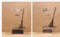
Escoba de plata 2006

A GANDIA, en 1998, vam ser guardonats amb l' Escoba de plata , per ser una ciutat pionera en la gestió mediambiental i de reciclatge. Ara, en 2006, tomem a ser guardonats amb l' Escoba de plata , seguim, a poc a poc, millorant en les polítiques ambientals. Apostant per idees innovadores: AIGUA POTABLE de qualitat, pla contra INNUNDACIONS i RADAR METEOROLÒGIC, ENERGIA SOLAR tèrmica, en noves construccions, espais NATURALS protegits. Catàleg d'ARBRES i ARBREDES d'interès local.