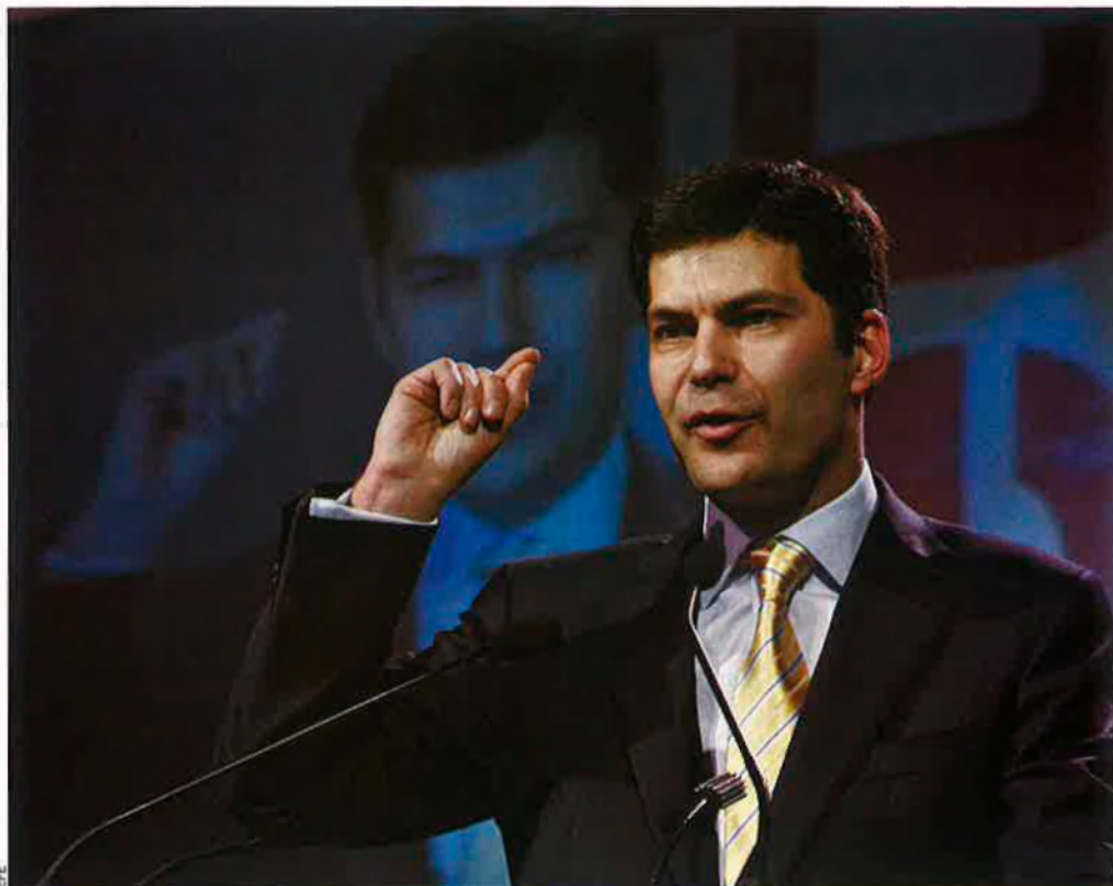
El líder d'Acció Democràtica (ADQ), Mario Dumont, s'adreça a la militància en la seu central del partit la nit de les eleccions generals del Quebec, el dilluns 26 de març.

Crisi oberta. A pesar de veure's relegat a la tercera posició de l'arc parlamentari, el sobiranista André Boisclair va intentar minimitzar els resultats. "Cal tenir en compte que només uns quants escons ens separen del poder, només uns milers de vots. Però la democràcia ha parlat. Els quebequesos volen un canvi i modestament hem d'acceptar-ho", va declarar el líder del