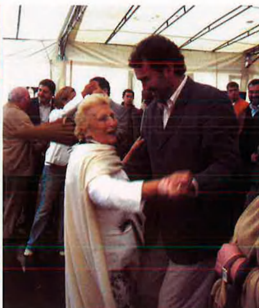
Al centre de la imatge de l'esquerra, l'expresident Fraga i el president Pérez Tourino, en un acte al Parlament gallec. Al costat, el vicepresident Quintana balla en una trobada amb gent gran.

el camp de l'ensenyament s'ha aconseguit poc més que assegurar que el 50% de les classes seran en gallec, tot i que, aquest sí, és un avanç destacable”.