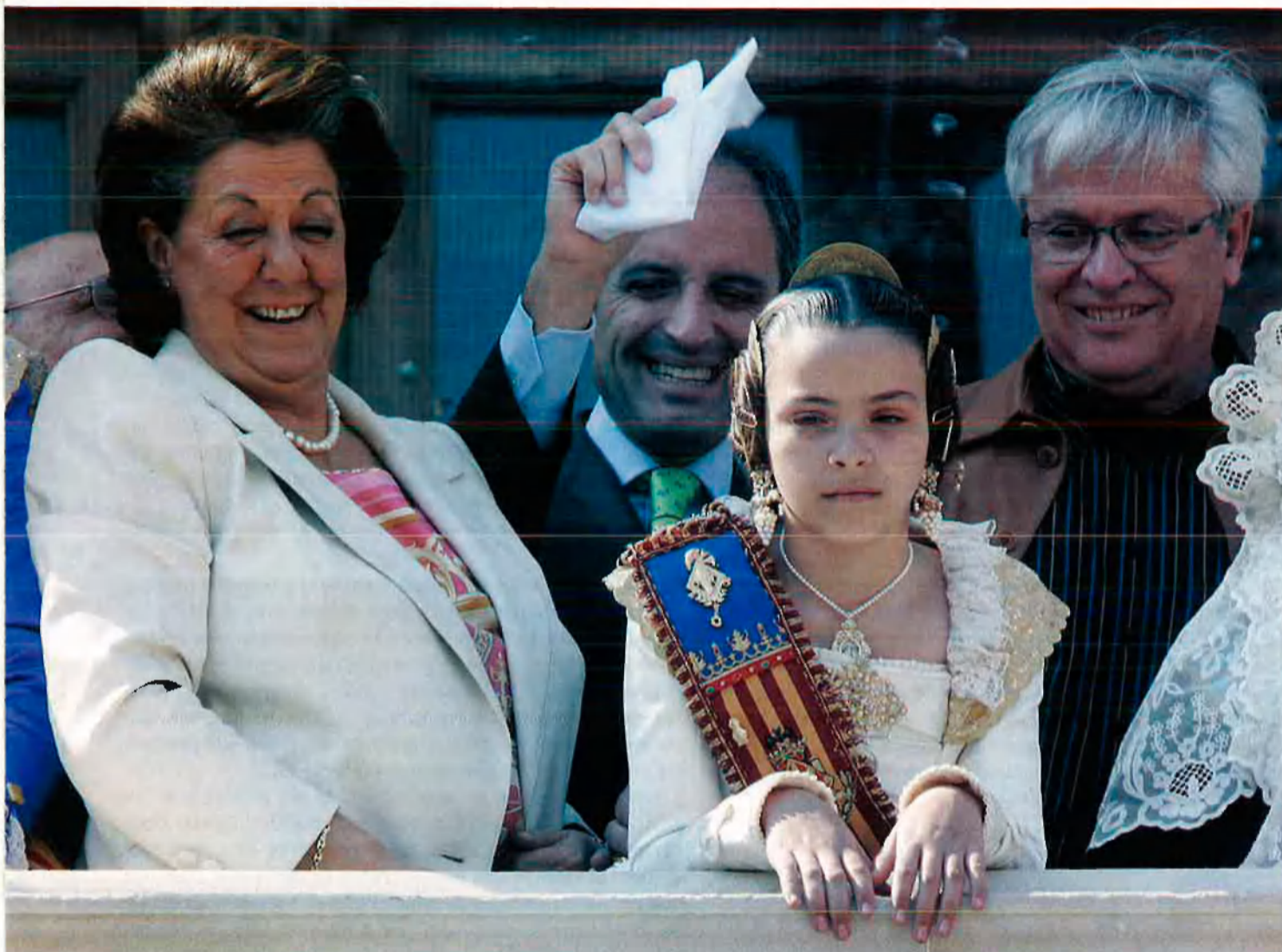
El ministre d'Indústria del Govern espanyol, Joan Clos, al balcó de l'Ajuntament de València, amb Rita Barberà, Francesc Camps i la fallera major Infantil, el passat 18 de març.

H avia de ser el 27 de març: el 27 de març del 2007, a les 9 del matí, s'haurien tancat, després de més de vint anys de trasbals i tenacitat, les emissions de TV3 al País Valencià. Així ho pretenia, almenys, la Generalitat que actualment ocupa el PP. I per comunicar-ho, i reclamar que els mateixos responsables del manteniment de les instal·lacions emissores –l'entitat cívica Acció Cultural del País Valencià, ACPV– obrissin les portes als funcionaris per a l'acte luctuós, es van presentar dos enviats de la Generalitat a la seu d'ACPV, el passat 22 de març. No van trobar ningú que els volgués signar el paperet: els responsables de l'entitat havien anunciat i explicat que no col·laborarien en un tancament que significava nítidament un atac a la cultura