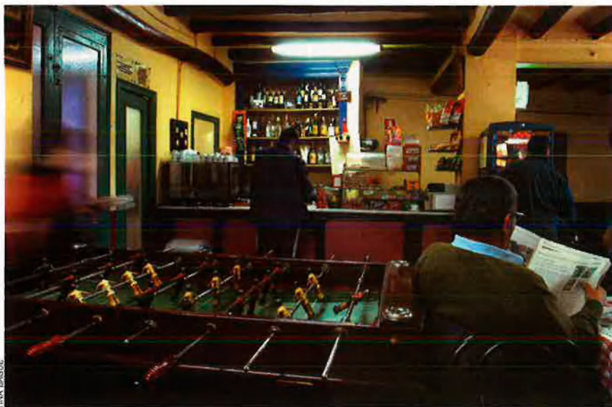
Una imatge del cafè Antic, a Porrera, que Lluís Llach va fer cançó.

fou masovera de les terres que tenia la mare de Llach a Porrera, assegurada davant un tallat abans de tornar al tros, explica, per exemple, que un dia "lo Lluís va sortir al vespre del cafè i no havia passat ni un quart d'hora que ja hi tornava a ser: 'Hosti, veniu, correu, veniu...!' I ens va portar a la carretera per ensenyar-nos la silueta de l'ermita de sant Antoni, amb els xíprers i la lluna que li sortia per darrere. 'Què passa?'. I ell: 'No ho veieu? És la lluna!' I nosaltres: 'Lluís, fa mil anys, que ho veiem, això'". I somriu. I fa una pausa. I continua: "Però és cert que de tant en tant algú t'ha de venir a dir que això que veus cada dia és bonic, perquè te'n tornis a adonar."