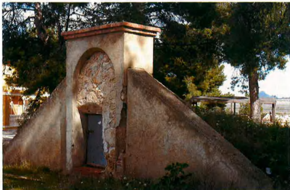
Accés a un dels búnquers que van servir de refugi als darrers resistents republicans a Monòver

Això, tanmateix, no va ocórrer tan bon punt acabà la guerra. Conta Poveda que la notícia del final del conflicte no aplegà ací fins al 2 d'abril: "Quedaven dos milicians. L'encarregat d'avisar-los va ser un sergent nacional, popularment conegut com el Ratoner. Era un valent d'aquests que es llançava a pit descobert enmig del camp de batalla carregat de granades. Així va anar fent mèrits i finalment el van recompensar donant-li treball com a conserge del parc municipal. Allà es complia