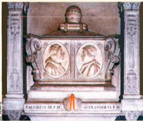
Sepulcre amb les restes de Calixt III i Alexandre VI, a Santa Maria de Montserrat, a Roma.

La presència de dimonis al voltant del cadàver responia a un altre element negatiu difós per diplomàtics venecians coetanis (Girolamo Priuli) que afirmava que Roderic de Borja "havia donat l'ànima i el cos al dimoni" a canvi de