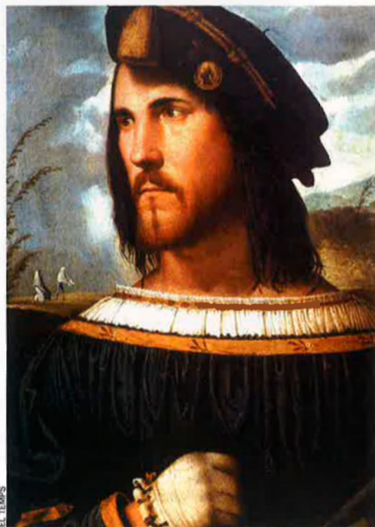
Una imatge coneguda: el possible retrat de Cèsar Borja, atribuït a Giorgione.

La tradició vianesa atribueix la profanació a la voluntat d'un bisbe de