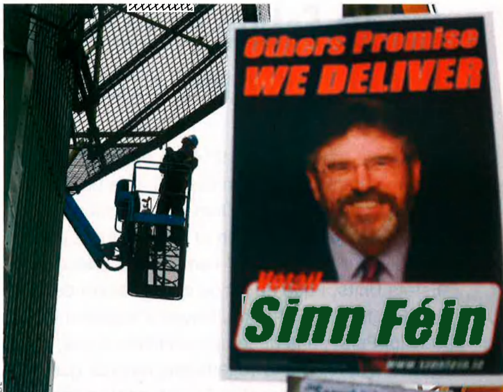
Per al Sinn Féin aquestes són unes eleccions decisives. Si els unionistes s'hi avenen, hauran de compartir el poder del nou Govern d'Irlanda del Nord.

El panorama no ha variat substancialment en les eleccions europees del 2004 o les municipals del 2005. El DUP ha encapçalat sempre els resultats. Ara, el DUP té més candidatures –46– que cap altre partit polític d'Irlanda del Nord. "Si no ens en sortim, en pocs anys estarem acabats", va dir un peixater, segons la premsa irlandesa, a Gerry Adams quan la setmana passada el líder republicà visitava Dargor Market, a North Down. Adams, a