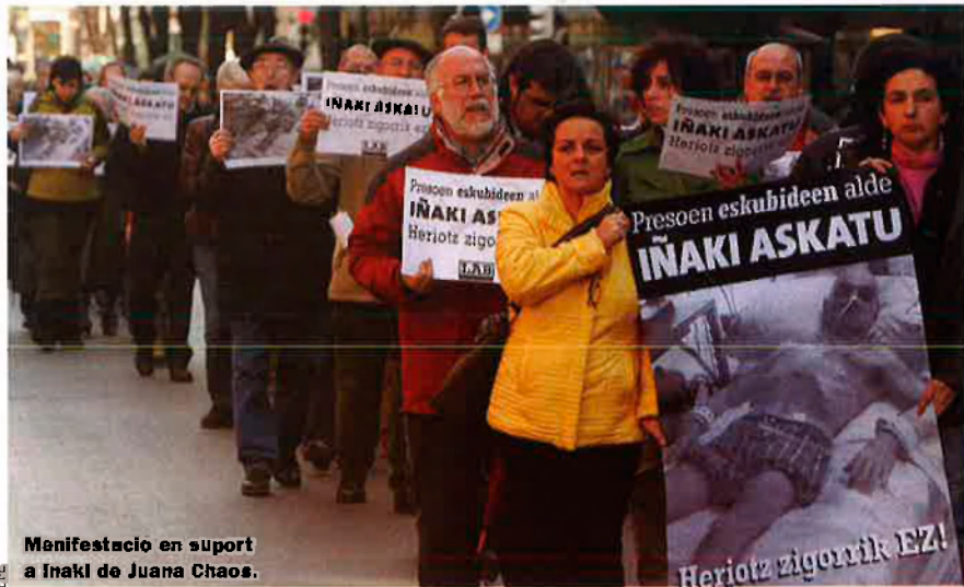
Manifestació en suport a Inaki de Juana Chaos.