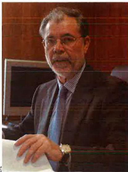
El nou ministre de Justícia, Mariano Fernández Bermejo, s'ha destacat sempre per no témer l'enfrontament directe amb els seus adversaris polítics, el sector conservador de la judicatura.

Un CGPJ com a eina política. La mateixa intervenció del nou ministre de Justícia en l'acte de presa de possessió del nou càrrec mostra l'alt nivell de confrontació política en el CGPJ. El ministre, conegut per la seva contundència a l'hora de respondre als seus adversaris, va parlar de la necessitat que el "CGPJ recuperi la legitimitat que no té per culpa del bloqueig que li impedeix de renovar-se". I és que al PSOE li convé una renovació d'aquest òrgan