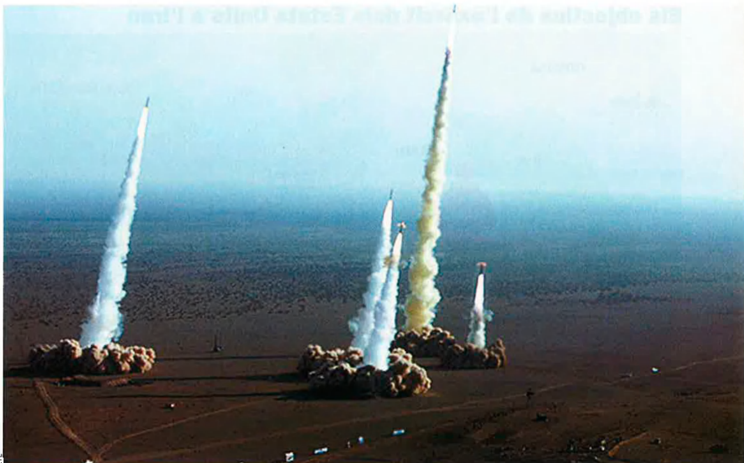
El règim iranià ha volgut donar mostres de la seva capacitat militar amb accions com el llançament de míssils de mitjà i llarg abast des de plataformes mòbils, fet al desert dels afores de la ciutat de Qom el passat mes de novembre.

J. Hadley, explicava fa uns dies a la cadena televisiva NBC que els Estats Units resistirien les temptatives de l'Iran de voler imposar la seva hegemonia a la regió i no negava, en una entrevista en una altra cadena poc després, que el seu govern estigués disposat a envair l'Iran.