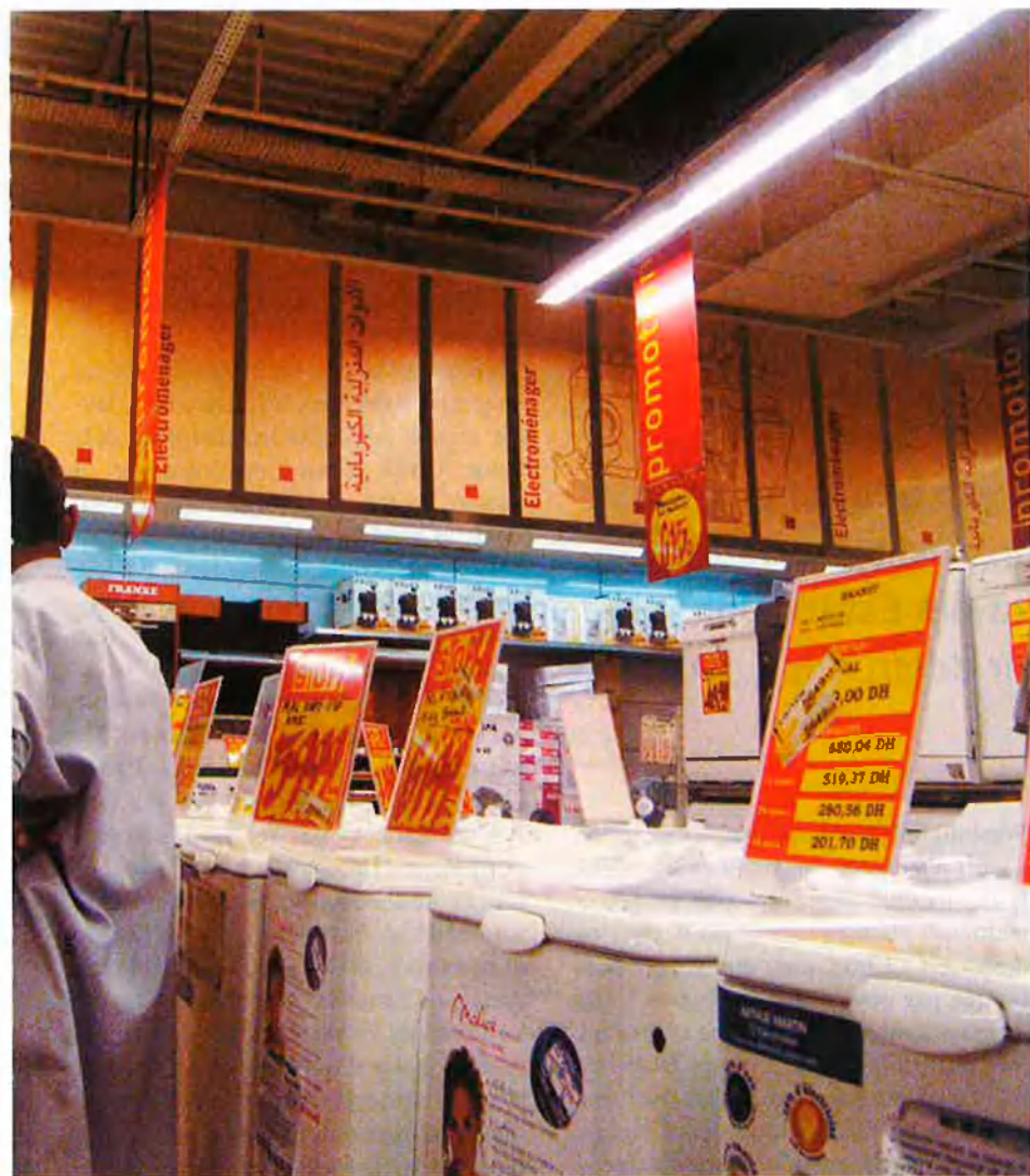
Un dependent d'una botiga de Casablanca mostra els electrodomèstics que hi ha exposats, alguns d'ells fabricats a la Xina, a un grup de clients interessats a comprar-ne un a bon preu.

busca el suport polític per a qüestions essencials per al Marroc com la resolució del contenciós del Sàhara Occidental. La presència de la Xina en el consell de seguretat de l'ONU i la seua importància en la institució internacional han obligat el Marroc a cedir i suavitzar les condicions d'implantació econòmica en el seu mercat nacional.