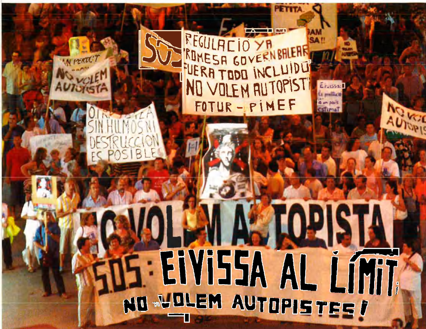
Les mobilitzacions contra les autopistes a Eivissa han forjat un moviment social que ha pressionat els partits progressistes perquè arribin a un acord per anar junts contra el PP a les eleccions.

E l dilluns dia 5 de febrer Europa Press difonia que “fontes de la direcció” estatal del PP “creuen que la majoria absoluta a les Illes Balears està ‘ballant’ a causa de la possibilitat que el PP perdi vots a Eivissa i Formentera”. Per un altre costat, diaris digitals editats a Madrid, de dreta (com Elsemanaldigital.com ), asseguren que la direcció federal del PSOE disposa d’una enquesta que lleva la majoria absoluta a Jaume Matas perquè perdrà, per culpa d’Eivissa i Formentera, un o dos escons i passarà dels trenta que té a vint-i-nou o vint-i-vuit. Tot i que els progressistes sovint desconfien d’aquestes notícies, que poden ser una operació per encoratjar les bases del PP a votar, també és cert que afronten