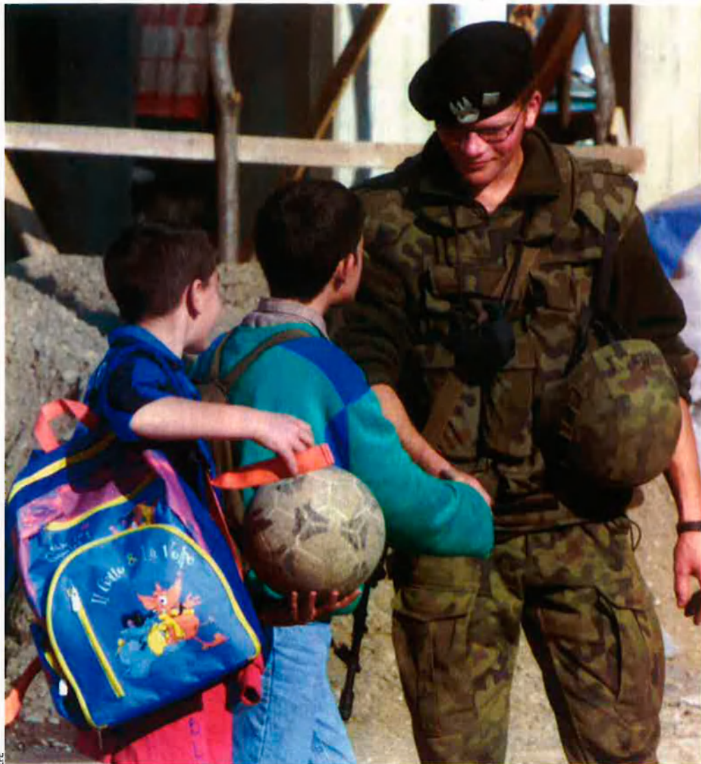
Uns nens kosovesos parlen amb un soldat de la KFOR, la força de l’OTAN desplegada a Kosovo, en una imatge presa l’any 2000.

Per la seva banda, la premsa de Belgrad afirma que els Estats Units i la Unió Europea ja s’han repartit la feina en aquesta qüestió. Els americans intentaran convèncer el Govern serbi, mentre que els europeus buscaran el compromís de Rússia. Encara és més, segons la premsa, el Govern de Washington ja ha instat el de Moscou a formular els seus desitjos a canvi de donar suport a la independència de