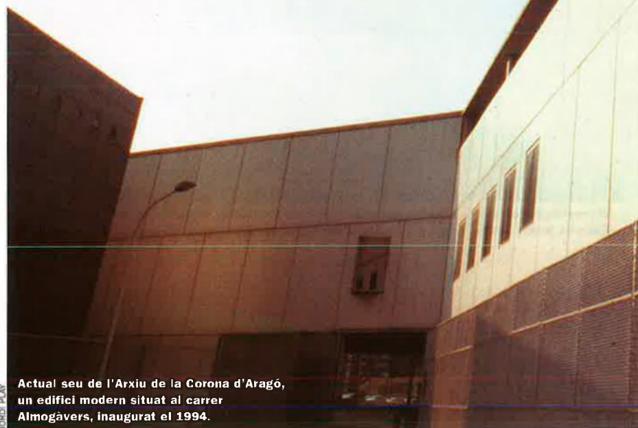
Actual seu de l'Arxiu de la Corona d'Aragó, un edifici modern situat al carrer Almogàvers, inaugurat el 1994.

Catalunya no pot renunciar a la denominació original i històrica de l'anomenat Arxiu de la Corona d'Aragó, Arxiu Reial de Barcelona, conclou l'IEC en un informe.