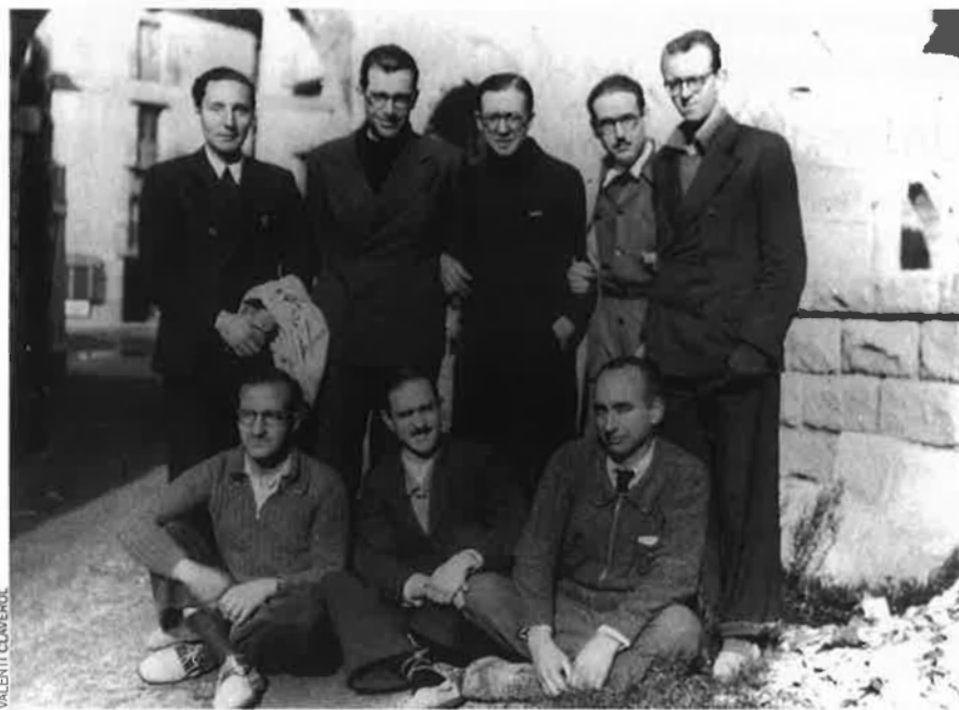
Josepmaria Escrivá de Balaguer, de peu al centre de la imatge, amb els seus companys d'expedició un cop arribats a Andorra

Després que el 28 de novembre aparegués el guia que els havia d'acompanyar fins a les portes d'Andorra, el periple fins al Principat es va allargar quatre dies, durant els quals el grup va caminar tant de dia com de matinada, dormint en cabanes i masies. Les vicissituds del viatge no van impedir, però, que Escrivá de Balaguer regalés als seus acompanyants les misses de rigor, de manera que l'alè espiritual els animava mentre pujaven i baixaven cims, travessaven boscos i rius. L'1 de desembre els guies