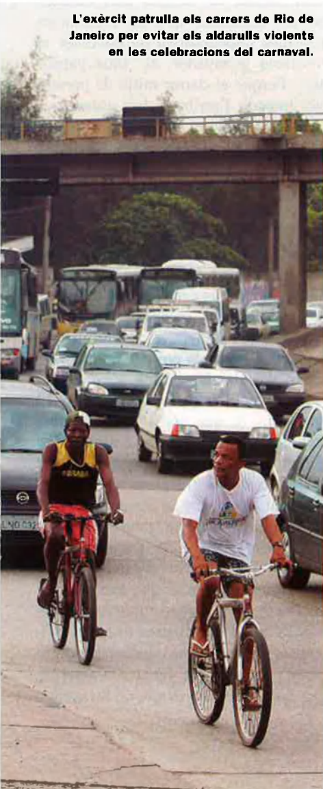
L'exèrcit patrolla els carrers de Rio de Janeiro per evitar els aldarulls violents en les celebracions del carnaval.