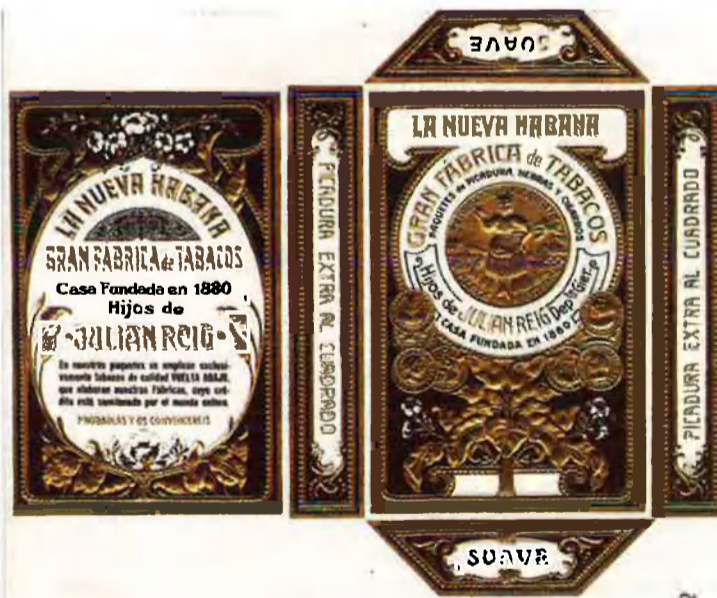
A l'esquerra, els primers treballadors de Tabacs Reig. A la dreta, La Nueva Habana, el producte estrella de la fàbrica durant els primers anys.