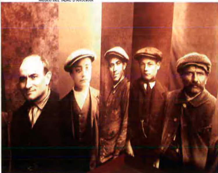
MUSEU DEL TABAC D'ANDORRA

ciudadans d'aquesta parròquia i de tot el país que hi han treballat, de manera que amb el tancament de la factoria també es posa punt final a la llarga his-