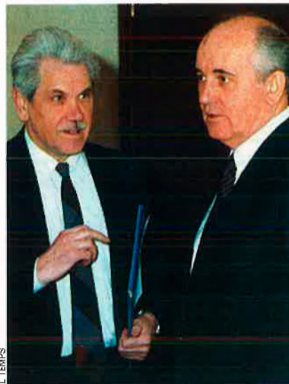
Mikhaïl Gorbachov i el seu assessor, Anatoli Txerniàiev, autor de les actes ara publicades.

sigui no afecta la seguretat real de la Unió Soviètica. Mikhaïl Serguèievitx, vostè diu: 'Si tot Alemanya s'incorpora a l'OTAN, aturem el procés de Viena i les negociacions sobre armes nuclears estratègiques.' Això, però, seria un cop mortal contra tota la política del nou pensament."