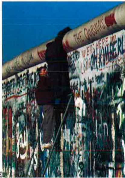
La caiguda de mur de Berlín va significar el final d'una època.

GORBATXOV: Quan rebo telegrams xifrats de la defensa militar, del KGB, sé de seguida el que és cert i el que ens volen fer creure. Vladímir Aleksandròvitx (Kriuixkhov), sí, et miro, a tu.