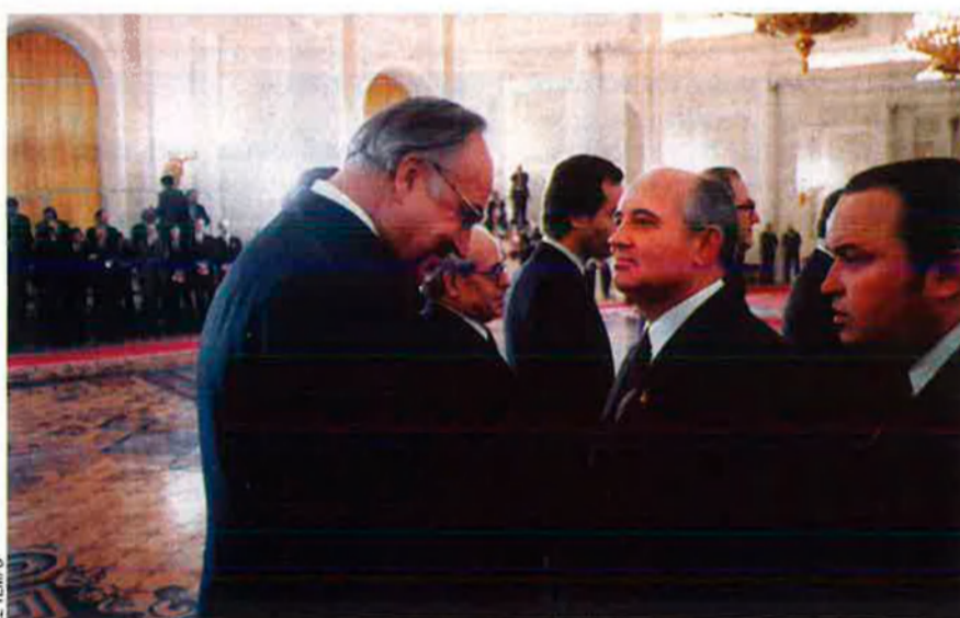
Al començament del seu Govern, Gorbachov va ignorar el president de la RFA Helmut Kohl perquè l'havia comparat amb Goebbels. Al final, Kohl era el seu principal interlocutor a Occident.

Els autors dels diaris de sessions. L'editor d'aquest recull d'actes i documents és la Fundació Gorbachov de Moscou, i el responsable de la tria ha estat el mateix exassessor Anatoli Txerniàiev, que ara té vuitanta-cinc anys. Aquest home, que durant més de vint anys va treballar en la secció internacional del comitè central del PCUS abans que Gorbachov el nomenés assessor l'any 1986, portava un diari i taquígra-