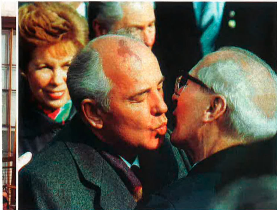
Gorbatxov amb l'últim president de la República Democràtica Alemanya, Erich Honecker, el 1989. La desconfiança era mútua.

'No dic ni una sola paraula de suport a Honecker. Dono suport a la república i a la revolució.'