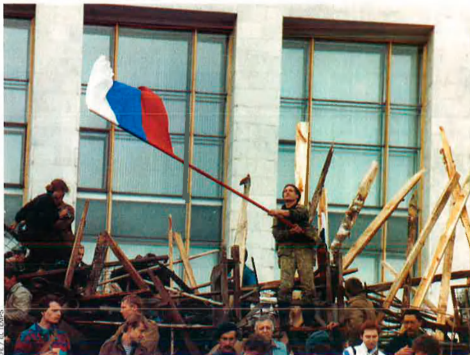
El 18 de gener del 1991 hi va haver un frustrat cop d'estat contra Gorbtxov, protagonitzat pel cap del KGB, Kriuixkov. Un any després, Gorbtxov dimiteix.

Gorbtxov i Honecker són dos homes que, de fet, no tenen res a dir-se. Psicològicament, portar a terme el canvi projectat davant de Bonn ajuda el cap del Kremlin. La notícia que ara, a Moscou, té el poder un home que manté la teoria