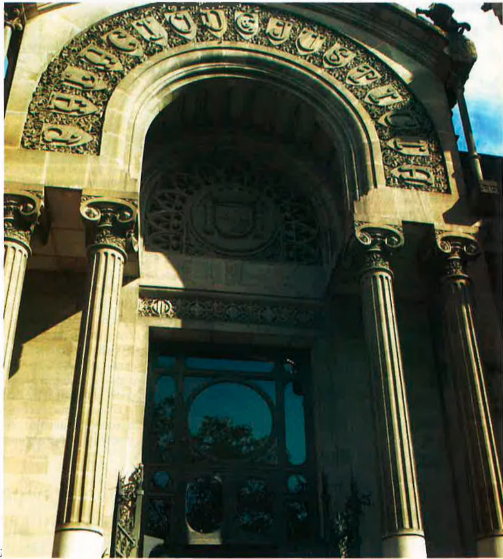
El nou text estatutari català preveu que el Tribunal Superior de Justícia de Catalunya sigui el garant dels drets reconeguts pel text legislatiu català.