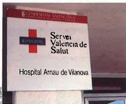
El servei Valencià de Salut deu 1.129 milions.

2. La factura sanitària. El forat econòmic de la sanitat pública es va estabilitzar i, fins i tot, es va reduir una mica al llarg del darrer any auditat. Com? No hi ha fórmules màgiques. El dèficit sanitari baixà un 8,8%, encara