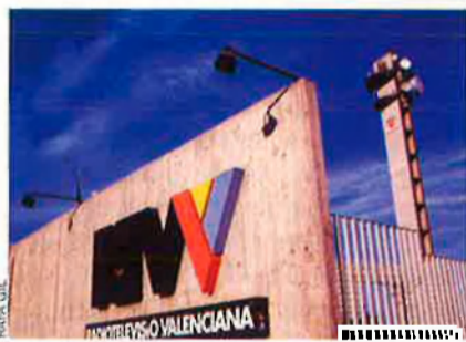
El deute de RTVV és astronòmic: 682 milions.

Ràdio Televisió Valenciana (RTVV) també hauria de tancar si s'aplicara la llei. Es troba, de fet, en una de les situacions de risc de dissolució de les quals parla la legislació vigent. I és que el problema té solució difícil. La Sindicatura de Comptes, de fet, reclama mesures excepcionals i més rigor en la gestió per posar fi al deteriorament que pateix la cadena, que, segons l'informe, necessita un pla de viabilitat urgentment. L'auditor públic entén que la cadena ha de tenir més cura a l'hora de controlar les despeses en matèria de producció de programes, compra de drets d'emissió com ara els del futbol o