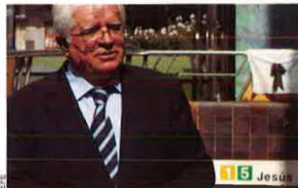
Ferrocarrils insegurs però endeutats.

La situació de les empreses lligades a la Conselleria d'Infraestructures, dirigida per José Ramón García Antón, és de fallida econòmica. De fet, entre Ferrocarrils de la Generalitat i l'Entitat de Sanejament, una societat encarregada d'executar obres hídriques, arrosseguen un deute de prop de 1.100 milions d'euros amb un creixement de més d'un 20% per sobre de l'any anterior. La Sindicatura de Comptes considera