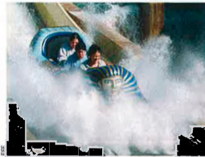
Terra Mítica deu 59,3 milions d'euros.

5. Projectes temàtics. La societat mitjançant la qual la Generalitat gestiona la seua participació en projectes d'oci com ara Terra Mítica augmentà el seu deute fins a arribar a una xifra pròxima als 500 milions d'euros. La situació del complex d'oci de Benidorm,