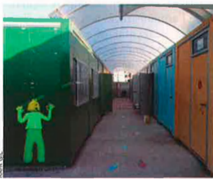
300 milions de deute i encara hi ha barracons.

4. Ciegua. L'empresa encarregada de la construcció de centres educatius augmentà un 70% el seu deute amb els bancs, que és superior als 300 milions d'euros amb préstecs que no s'acabaran de liquidar fins al 2030. A més, les pèrdues van créixer un 87%. La gestió és caòtica. De fet, la Sindicatura de Comptes torna a insistir en els sobre-