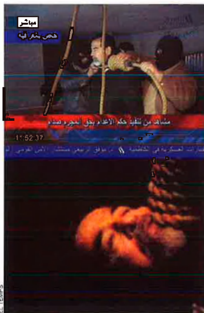
La divulgació de les imatges de l'execució de Saddam Hussein ha estat molt criticada.

Com a símptoma de la posició dubitativa dels EUA sobre l'execució, l'ambaixador Zalmay Khalilzad havia intentat per tots els mitjans convèncer el primer ministre iraquità, Nuri al-Maliki, que la cancel·lara o, si més no, que