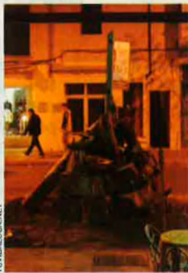
El pi de Sant Antoni de Pollença.

Als pins alenen infinitud, el seu harmoniós murmurar ens fa respirar perfums sagrats. La remor del vent entre la pinotxa parla el llenguatge més vell de la terra, contagia la nostra sang amb la frescor del temps dels déus. Foren rectes columnes dels temples més primitius al màgic bosc de la salut i la salvació, "aquells pins com una catedral"! Per això, per portar al poblat els efectes benèfics del forest, ara es planten a les nostres places majors; van, tallats, com una divinitat vençuda, abatuda, però, en enlairar-los, ressusciten i, al centre dels municipals melics de l'univers, es transfiguren en eixos del món. Passa a Pollença, al nord de Mallorca, o a Alcalà de la Jovada, a la Marina Alta, repoblada per mallorquins al segle XVII, o a Figueró de Montmany i Matadepera, al Vallès, o a les barraques diableres dels Ports. Presideixen el nostre solstici d'hivern. La vella Grècia ja els