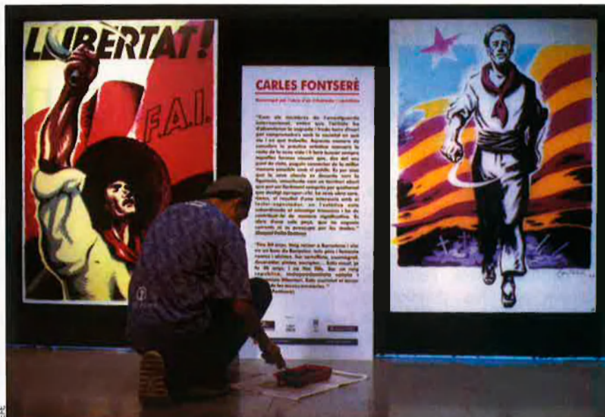
El cartellisme de Carles Fontserè durant la Guerra Civil ha d'ocupar un lloc preferent en totes les exposicions, com l'organitzada al Museu d'Història de Catalunya.

A més, Carles Fontserè ha presentat, i representat, la cara amable, honesta i innocent de la revolució anarquista del 36 –les seves mans es van tacar de tinta, no de sang– en un moment, curiosament, que cada cop es veu més clar que els assassinats d'aquells primers mesos d'aquella burgesia criticada per Fontserè com també la destrucció del patrimoni artístic religiós, no eren pas obra d'incontrolats, sinó accions promogudes, des de l'arenga, pels dirigents; és a dir, eren el simple pas de la paraula a l'acció, era la revolució mateixa.