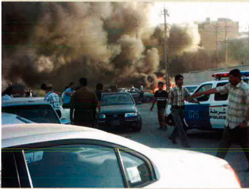
Amb la mort de Saddam tothom tem que la insurgència acabi sumint el país en una veritable guerra civil.

L'execució de Saddam, altrament, pot comportar un augment de les hostilitats entre xiïtes i sunnites i el risc de guerra civil entre totes dues comunitats es fa cada dia més evident. Saddam, finalment, líder d'un partit laic, és convertit en màrtir dels sunnites de l'Iraq. Morí amb l'Alcorà a la mà i pronunciant la xahada, la professió de fe musulmana, mentre era increpat, com demostra un vídeo enregistrat al moment de l'execució, pels seus botxins xiïtes.