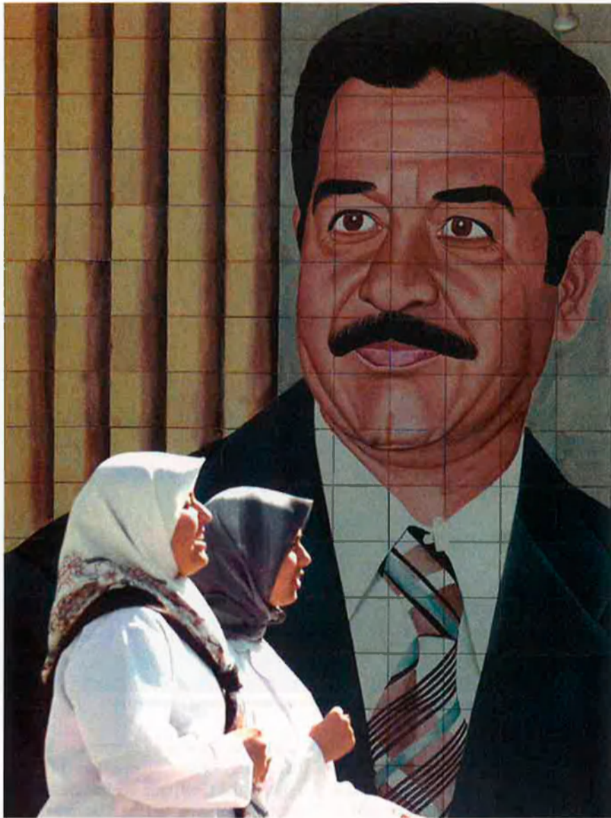
Els carrers de Bagdad, durant el mandat de Saddam estaven decorats amb imatges del dictador. La caiguda de la estàtua, lligada del coll, va ser preminotòria del destí que li esperava.

Ja president, Saddam creà un viceprimer ministre, que recaigué en Taha Yasin Ramadan, i cinc ministres delegats, entre els quals destaquen el seu cosí Adnan Khayr Allah, en Defensa, i Tariq Aziz –la cara amable del règim–, en Exteriors. El 1980 Saddam restablí el poder legislatiu o Assembla Nacional, suspesa des de la caiguda de la monarquia el 1958, però a la manera de pantomima democràtica, ja que la totalitat dels 250 diputats eren militants del Baath saddamista. I és que Saddam acostumava a dir: "S'ha d'assegurar que els tretze milions i mig –el nombre d'electors– prenen el mateix camí. Qui triï el camí contrari trobarà l'espasa."