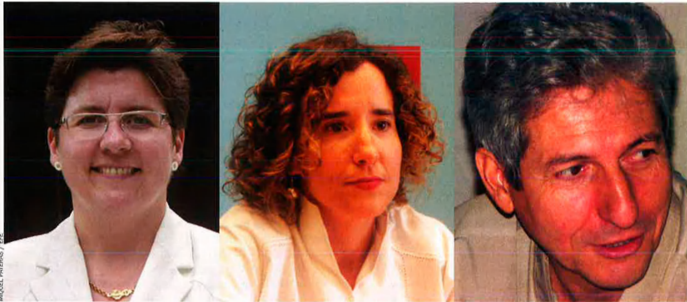
MICHEL PAYERAS / EFE