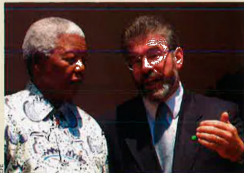
Nelson Mandela, expresident de Sud-àfrica, i Gerry Adams, líder del Sinn Féin.

De fet, les relacions entre Irlanda del Nord i Sud-àfrica van més enllà dels nacionalistes irlandesos, ja que fou precisament del sud del continent africà en època d'apartheid on es detectà un vaixell que havia de dur armes als lleialistes nord-irlandesos.