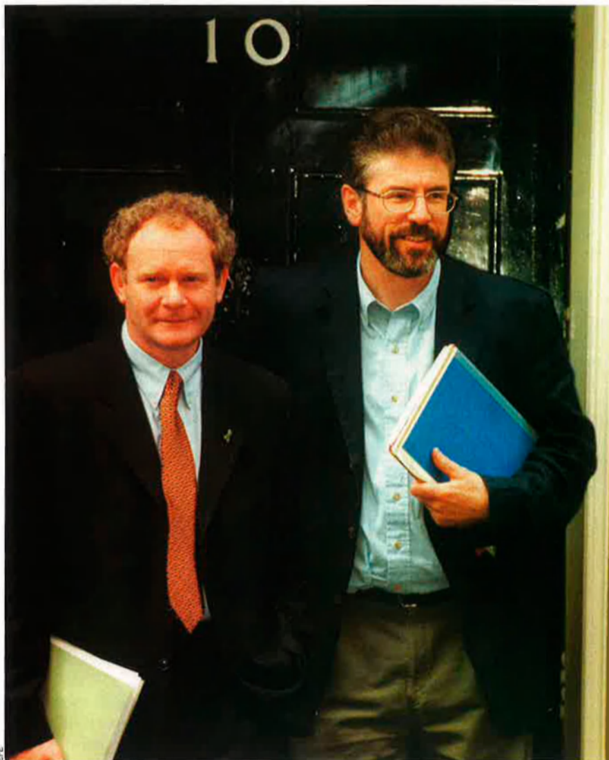
Gerry Adams i Martin McGuinness, els dos líders del Sinn Féin, a Downing Street.

Tampoc no va ajudar gaire que a la República d'Irlanda caigués el Govern per una qüestió de política interna i que fos nomenat primer ministre John Major, que abandonà el posicionament nacionalista irlandès que havia mostrat Reynolds i es presentà com a part neutral, negant-se fins i tot a rebre Adams i Hume. Amb la part irlandesa debilitada, John Major va fer algun gest important, com la primera trobada oficial entre el Sinn Féin i el Govern britànic, el 10 de maig del 1995, però la resta de mesures empreses pel seu executiu no van ajudar a mantenir l'optimisme inicial: Major insistia a dir que l'alto el foc havia de ser "permanent" i retardava qualsevol pas endavant.