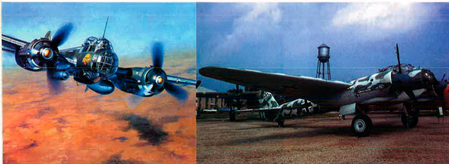
Tres aparells bimotor alemanys Junkers Ju 88.

Una de les ràfegues de l'avió britànic va anar a parar a la façana de l'ajuntament d'Eivissa, i va deixar els senyals a la paret i en un balcó durant anys