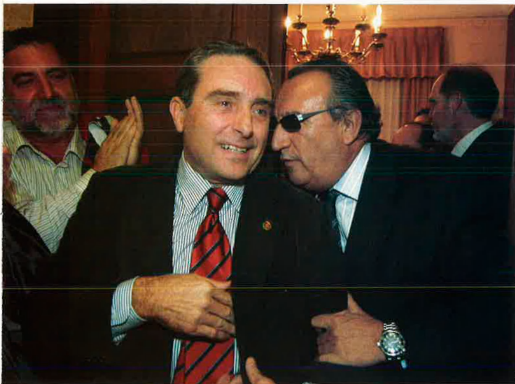
Fabra va acompanyar Manuel Vilanova, alcalde de Vila-real, en la seua visita als jutjats.

El Suprem ha inhabilitat l'alcalde de Vila-real, la segona ciutat de les comarques de Castelló, per no actuar contra els sorolls que emetia una empresa. A més, el cap de la Diputació, Carlos Fabra, està imputat per tres suposats delictes. El PP mira amb temor els comicis del maig.