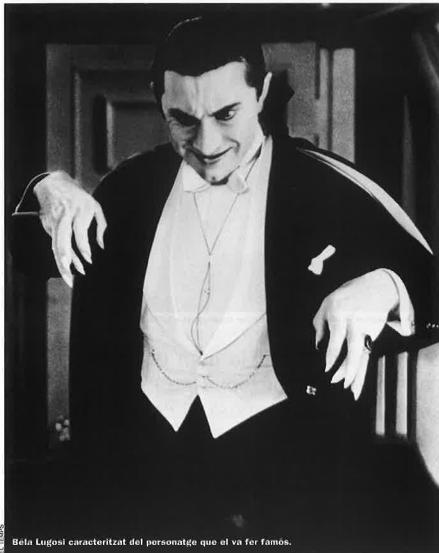
Béla Lugosi caracteritzat del personatge que el va fer famós.

Ell ens va fixar a l'imaginari l'estil i el posat del comte Dràcula, amb capa i vestit de nit, entre atractiu i tenebrós: retrobem Béla Lugosi en el cinquantenari de la seva mort. Si és que moren, els vampirs.