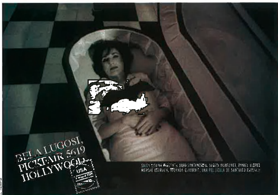
Una de les imatges promocionals del film rodat a la Valldigna.

gosi”, comença, amb tota la naturalitat del món) i convidar-lo a instal·lar-se a la Valldigna. Res de nou a l'oest. Fins que rep resposta: “Dear Mr. Hervàs”, li diu el vampir. I el film, a la seva mane-