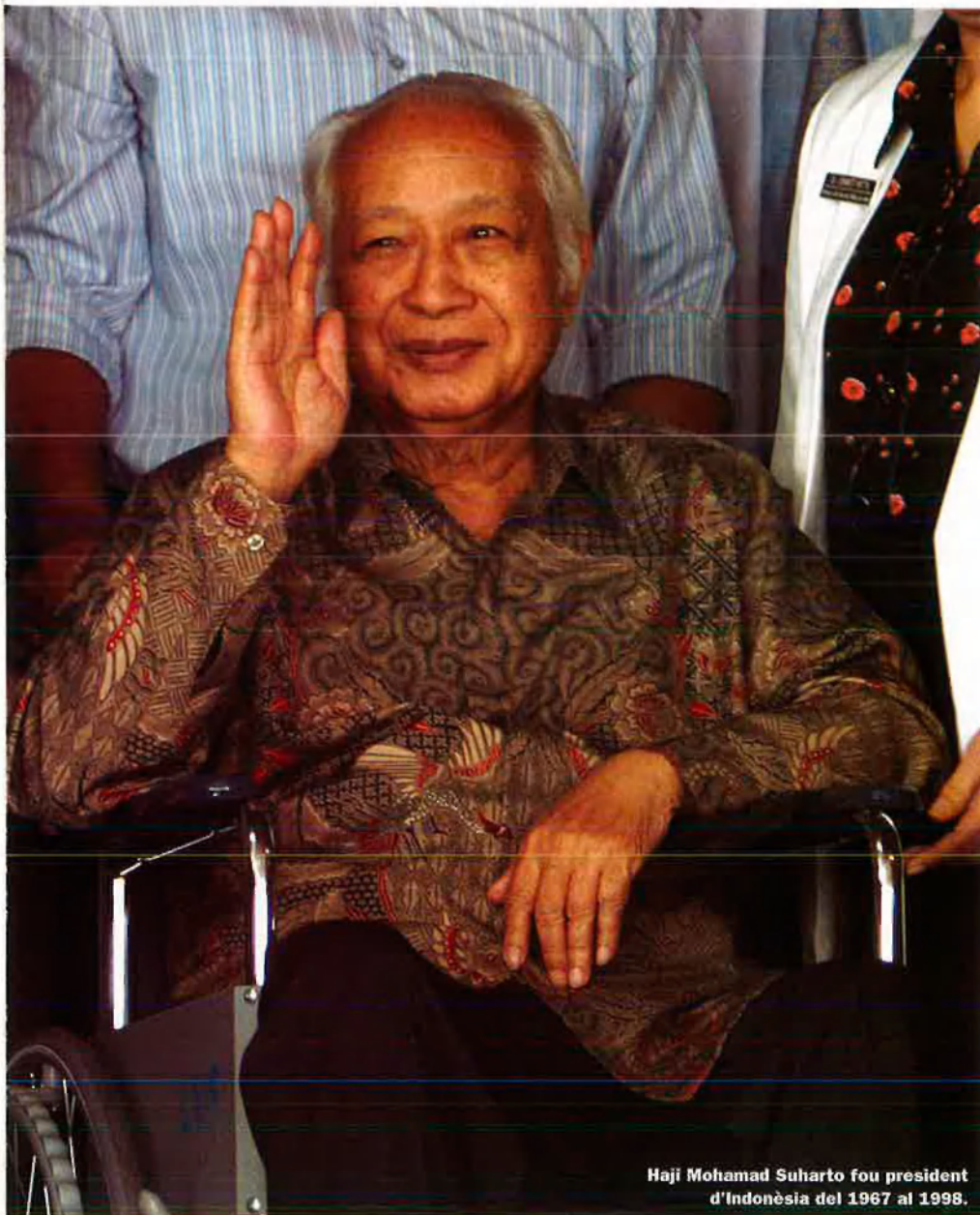
Haji Mohamad Suharto fou president d'Indonèsia del 1967 al 1998.

La mort del general Augusto Pinochet sense que hagi pogut ser jutjat mostra de nou la dificultat que hi ha per portar als tribunals els antics dictadors. Arreu del món, de fet, hi ha encara una vintena de tirans que han escapat de la justícia, ja sigui gràcies a la malaltia, a l'exili o a les lleis de perdó.