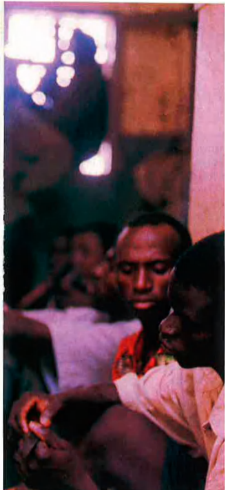
Un grup de nòis ajaguts, passant el dia, al centre de detenció de subsaharians d'Al-Aalun.

pateixen diàriament immigrants subsaharians. Abans d'amagar-se, molts d'ells arriben a la seva vida acostant-se a l'ACNUR per inscriure-s'hi.