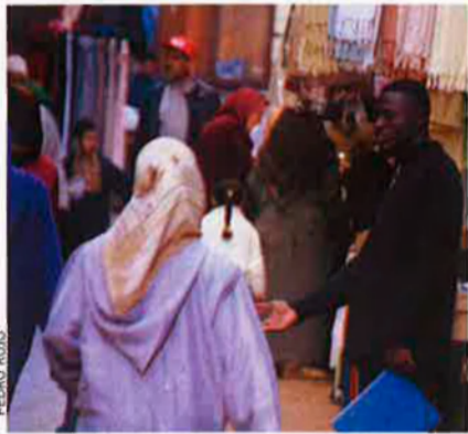
Un noi subsaharià demana almoïna al carrer, a la medina de Tànger.

La situació dels immigrants subsaharians va empitjorar amb la reacció de