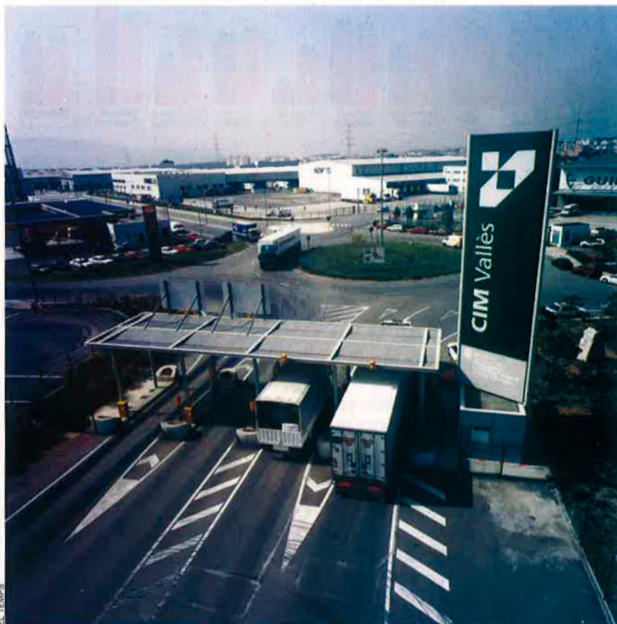
La indústria de l'àrea metropolitana de Barcelona va perdre corda el 2005, i l'eix gironí s'ha situat líder en creixement. Però tot indica que enguany Barcelona recuperarà el lideratge.

Les comarques gironines van liderar el 2005 el creixement de l'economia catalana, impulsat per la construcció i els serveis. Des de fa uns anys, però, el país experimenta un retrocés industrial concentrat en l'energia i el tèxtil. Així ho assenyala l' Anuari econòmic comarcal de Caixa Catalunya '. Amb tot, les dades disponibles de 2006 indiquen un canvi: l'àrea metropolitana recuperarà el lideratge, mercès a la revifalla industrial.