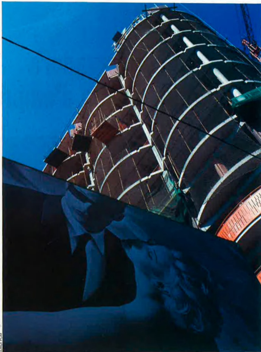
El sector de la construcció continua en expansió.

Malgrat que en cada comarca es pateixin crisis de sector determinades per la seva especialització històrica, les dades de l' Anuari econòmic comarcal de Caixa Catalunya posen de manifest que, en la majoria dels casos, l'economia local ha sabut trobar altres