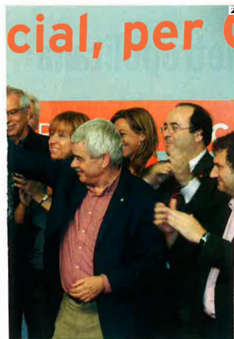
A l'esquerra, Duran Lleida, Mas i Pujol celebren la victòria de CiU als comicis. A la dreta, José Montilla i Pasqual Maragall es mostren victoriosos un cop sabuts els resultats oficials.

gués robar part de l'electorat, els populars també van aguantar l'embranchida. Van perdre 80.000 vots –10.000 menys que els que va obtenir Ciutadans–, però aquest descens només es va traduir en un diputat menys i van passar de 15 a 14. Pel que fa a aliances, tot i que CiU ja va deixar clar que no volia pactes amb el PP, aquestes dues formacions tampoc no sumarien (62).