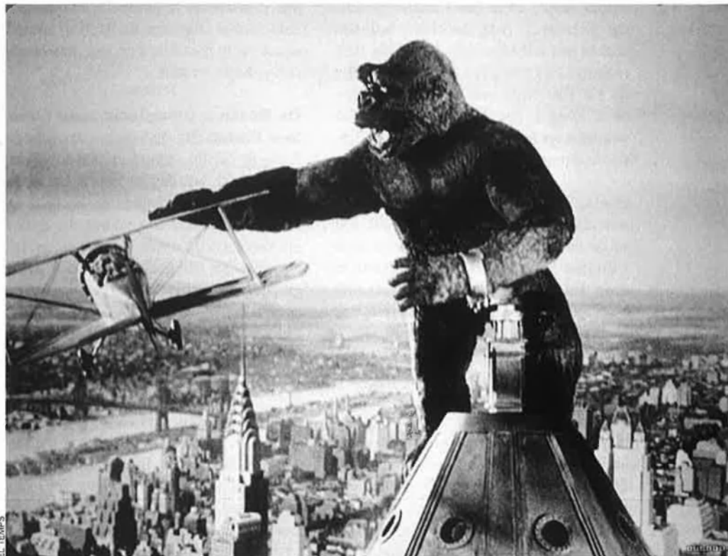
King Kong, enfilat a dalt de l'Empire State.

L'Empire State, la torre Eiffel o la Pedrera han servit de paisatge cinematogràfic per a la pantalla. Protagonistes arquitectònics d'algunes de les obres que han assenyalat la història del cinema del segle XX.