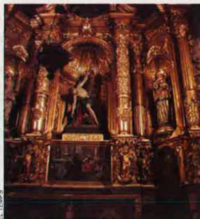
"Al mateix temple el torna a retratar, la capella de sant Sebastià."