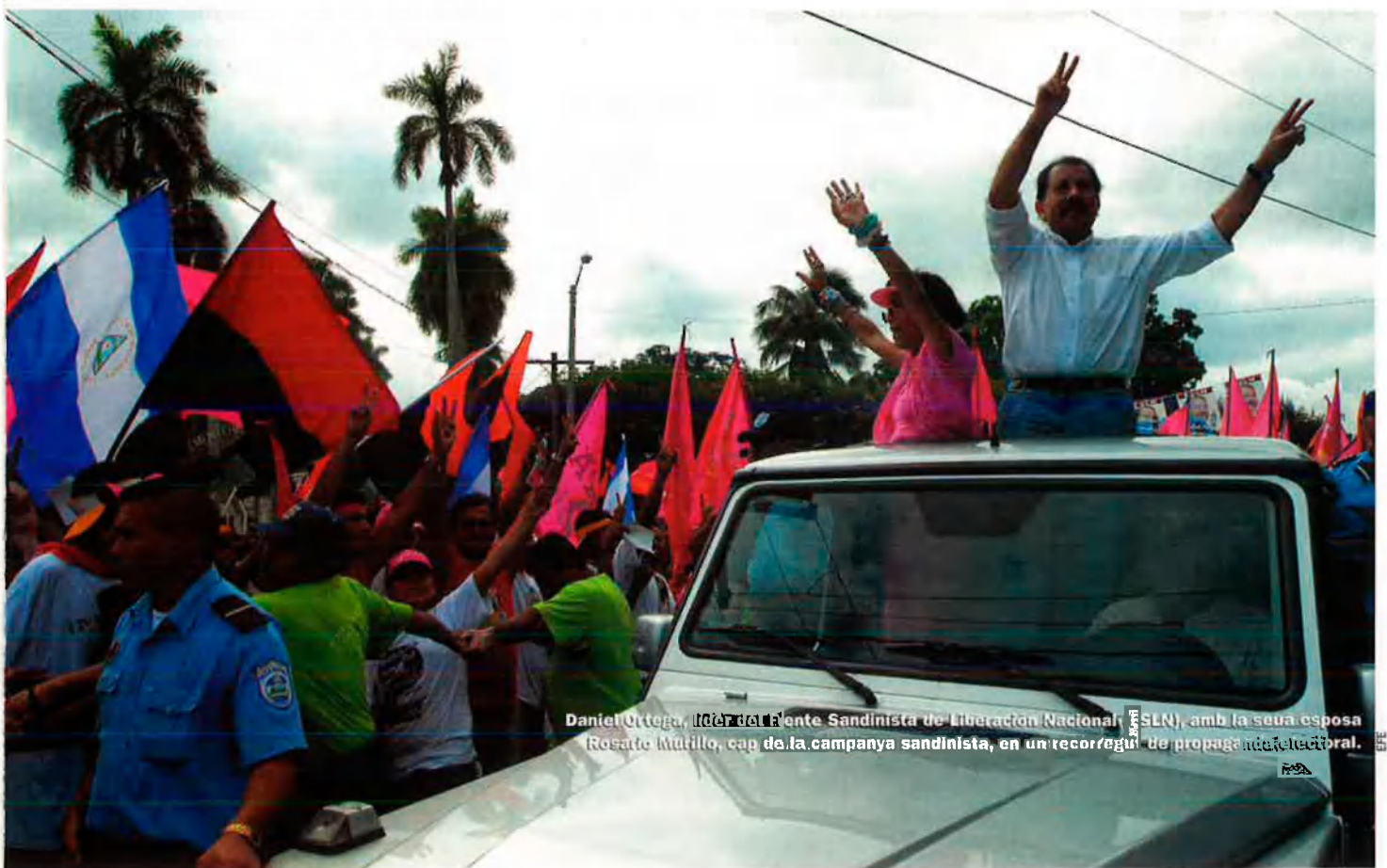
Daniel Ortega, líder del Front Sandinista de Liberación Nacional (FSLN), amb la seva esposa Rosalva Murillo, cap de la campanya sandinista, en un recorregut de propaganda electoral.

tres anys de dictadura de la família Somoza. Va ser llavors quan els Estats Units van veure en Ortega la reencarnació mateixa del cubà Fidel Castro i Nicaragua es va convertir en un sagnant escenari de la guerra Freda a Amèrica Central. L'operació Iran- contra , una xarxa de venda il·legal d'armes nord-americanes a Teheran a canvi de transferències de diners a l'escamot antisandinista, va encoratjar una guerra civil que va deixar més de 30.000 morts. Destapat l'escàndol el 1986, diversos funcionaris de Ronald Reagan van ser condemnats o van haver de renunciar. Molts d'ells han tornat a la Casa Blanca per mà de George W. Bush. Per això no ha d'estranyar que l'Organització d'Estats Americans (OEA) hagi demanat als Estats Units que no intervingui amb les seves opinions en la campanya electoral. Avui Ortega assegura que "un cop superada la situació de guerra dels anys vuitanta, ja en pau, he arribat al convenciment que no hi ha més alternativa que la reconciliació perquè el país pugui caminar". En públic li agrada