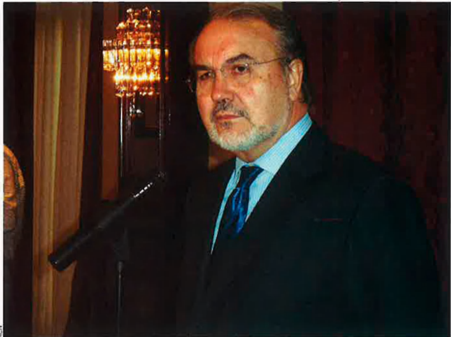
El ministre d'Economia, Pedro Solbes. Els seus números sobre quina ha de ser la inversió de l'estat en matèria d'infraestructures ja fan entreveure que el desplegament estatutari no és fàcil.

La resposta de l'alt tribunal estatal, que podria arribar en un termini no superior als sis mesos, serà determinant. Una retallada substancial del text pot provocar un problema polític institucional de magnituds considerables, ja que es veurien frustrades, només d'entrada, les aspiracions d'autogovern de Catalunya, ja prou retallades durant el procés de negociació a les Corts. La composició del nou govern català serà determinant per calibrar fins a quin