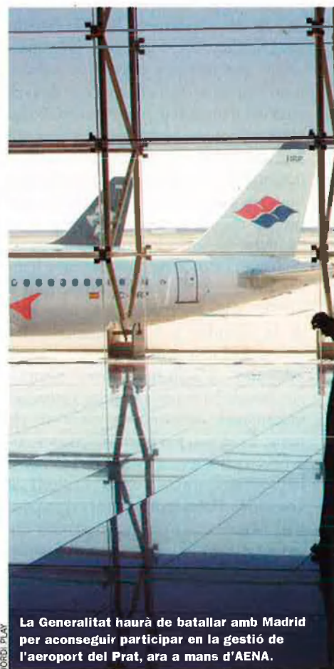
JORDI PLAN La Generalitat haurà de batallar amb Madrid per aconseguir participar en la gestió de l'aeroport del Prat, ara a mans d'AENA.

E l nou Estatut recull una disposició addicional que compromet el Govern espanyol a invertir en infraestructures –segons Madrid només aquelles que depenen de Foment i Medi Ambient– l'equivalent a l'aportació del PIB català al total espanyol, excloent del càlcul el fons de compensació interterritorial, i per un període de set anys. Fa unes setmanes, la proposta de pressupostos de l'estat 2007 presentada per Pedro Solbes va deixar clar que no tothom calcula igual, i que no hi haurà prou partida per afrontar els reptes que tindrà Catalunya en infraestructures com trens, ports, aeroports i carreteres. El nou Govern haurà d'administrar la caixa per intentar donar resposta al màxim nombre d'expedients que es trobarà sobre la taula.