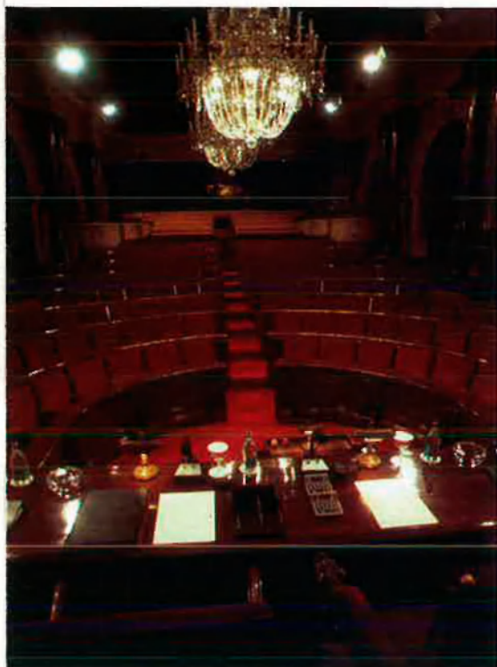
EL TEMPS El desenvolupament del nou Estatut serà un dels principals reptes del Parlament català.

estructures l'equivalent a l'aportació catalana al producte interior brut espanyol (PIB), exclòs el fons de compensació interterritorial.