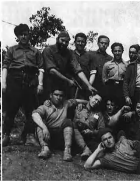
Dues fotos inèdites de l'Arxiu Pol Galitó. Soldats nacionals a Vilanova de Meià, el 27 de desembre del 1938. A la dreta, un grup de milicians, descansant a Osca. A sota, el pont de Fraga, volat pels republicans, retratat per l'exèrcit franquista. Són imatges del volum de Pagès Editors.

La imatge de guerra secundària ha estat segurament alimentada, consideren els autors, pel captivament de Franco mateix, en fer avançar primer les seves tropes a corre-cuita des d'Aragó per, després, obligar-les a fer una deturada que a molts els va semblar absurda, ja que tothom pensava que les tropes nacionals tenien la conquesta de Catalunya a tocar dels dits.