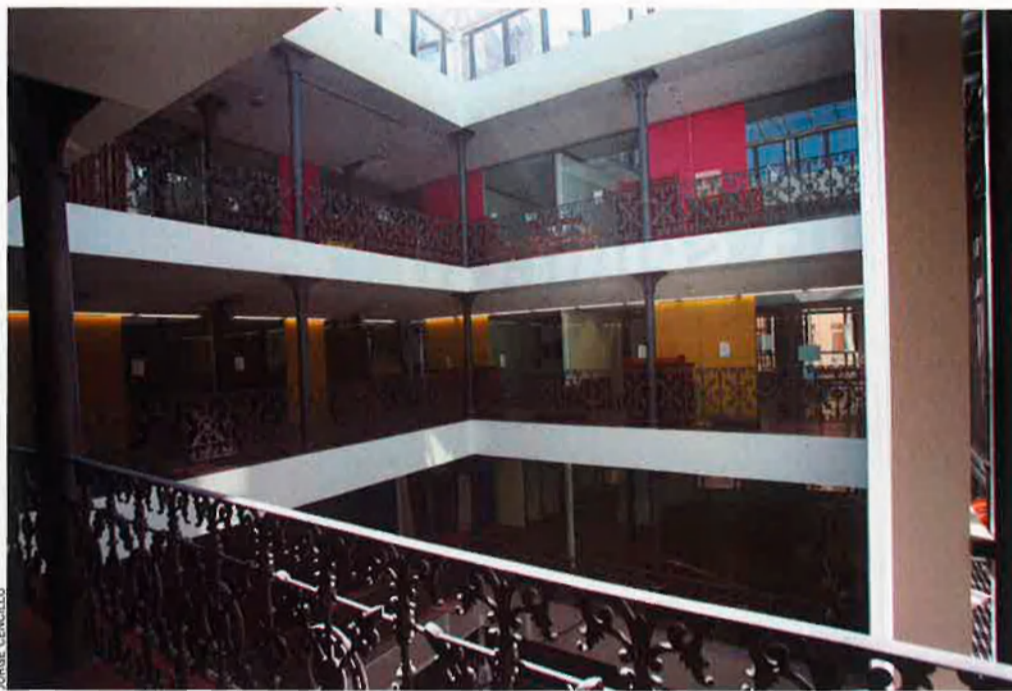
Tot i la modernització de les instal·lacions per adaptar-les a les necessitats actuals, l'edifici conserva la seua estructura original i la reixa de forja que envolta la llumera central.

Tot i així, el trencament definitiu amb l'estructura urbana no arribarà fins més endavant, quan, a partir dels anys seixanta, les grans superfícies comercials modernes emigren a les zones periurbanes i s'erigeixen com a vertaderes ciutats independents, alienes als fluxos urbans, als transports públics i a les dinàmiques urbanes vidents fins al moment. Al cap i a la fi, segons assenyala l'arquitecte Oriol Bohigas en un article de premsa, els grans magatzems del segle XIX, com El Siglo, no afectaren excessivament la geografia comercial urbana, perquè encara es mantenen sobre la base de l'organització de la vida col·lectiva entorn de carrers i places, continuen vinculats als accessos pensats per als vianants i al transport públic, actuen