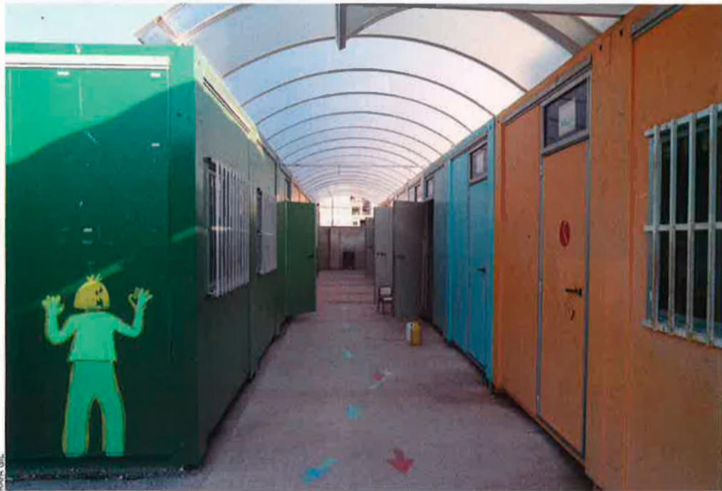
L'escola Camp de Túria, a Ribarroja, existeix des de la virtualitat dels barracons: de fa sis anys esperen una escola que no s'ha començat a construir.

A les Illes Balears, per exemple, on els barracons són un apunt pràcticament anecdòtic, la problemàtica no hi és tant per “una qüestió d'aules prefabricades com de manca de planificació en el disseny escolar”, destaquen a l'STEI-i: “Aquí s'ha apostat més per ràtios elevades que per aules prefabricades”: s'augmenta, per tant, el nombre d'estudiants