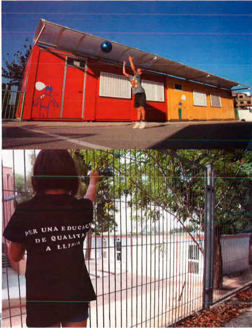
A dalt, un xiquet, a l'escola Camp de Túria. A sota, els barracons instal·lats al pati de l'escola Sant Miquel, a Llíria, i una alumna amb la samarreta que acaba d'editar l'AMPA.

(“classes conjunturals”, en diu) és “mostra que s'està construint més que mai”. Potser sí que ho seria sobre el paper, si aquests contenidors de taules i cadires i persones de tota mida fossin espai provisional mentre s'alça el definitiu. Davant dels barracons de l'escola virtual de Ribera-roja, que viu sencera en una provisionalitat d'anys, les paraules oficials semblen sarcasmes.