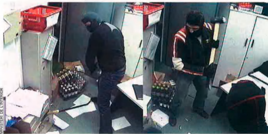
Imatges preses a través d'una càmera de seguretat, que mostren dos membres d'una banda d'albanokosovars que es dedicaven a cometre robatoris amb el mètode del butron.

s'ha acostumat a veure-les a la rodalia de gasolineres i polígons industrials, places abans pròpies de les prostitutes locals més terminals. Les últimes innovacions d'aquestes màfies són la falsificació de documents i, amb l'ajut de hackers locals o forans, la pràctica de diversos tipus d'estafes per Internet.