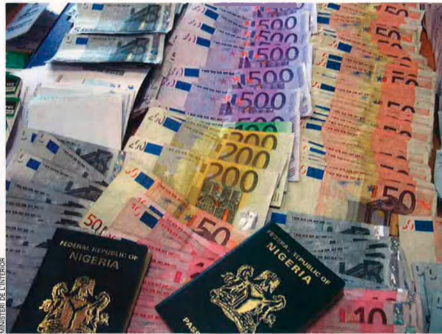
La policia va intervenir 19.000 euros el passat abril a dues organitzacions delictives dedicades al tràfic de persones per explotar-les sexualment, amb centre d'operacions a València.

Tot això, lògicament, ha impulsat canvis constants en el sector de la venda de sexe i del treball esclau, una de les activitats preferides per totes les màfies –africanes i orientals incloses– implantades al nostre país. Les prostitutes importades són ara més abundants, més joves i més barates –el sexe amb xiques menors pot aconseguir-se per 30 euros a la carretera– que fa un any, i el client s'ha acostumat que tinguen cara, orella o nas tallats per ganivets, marca de la casa dels proxenetes de l'Est. També