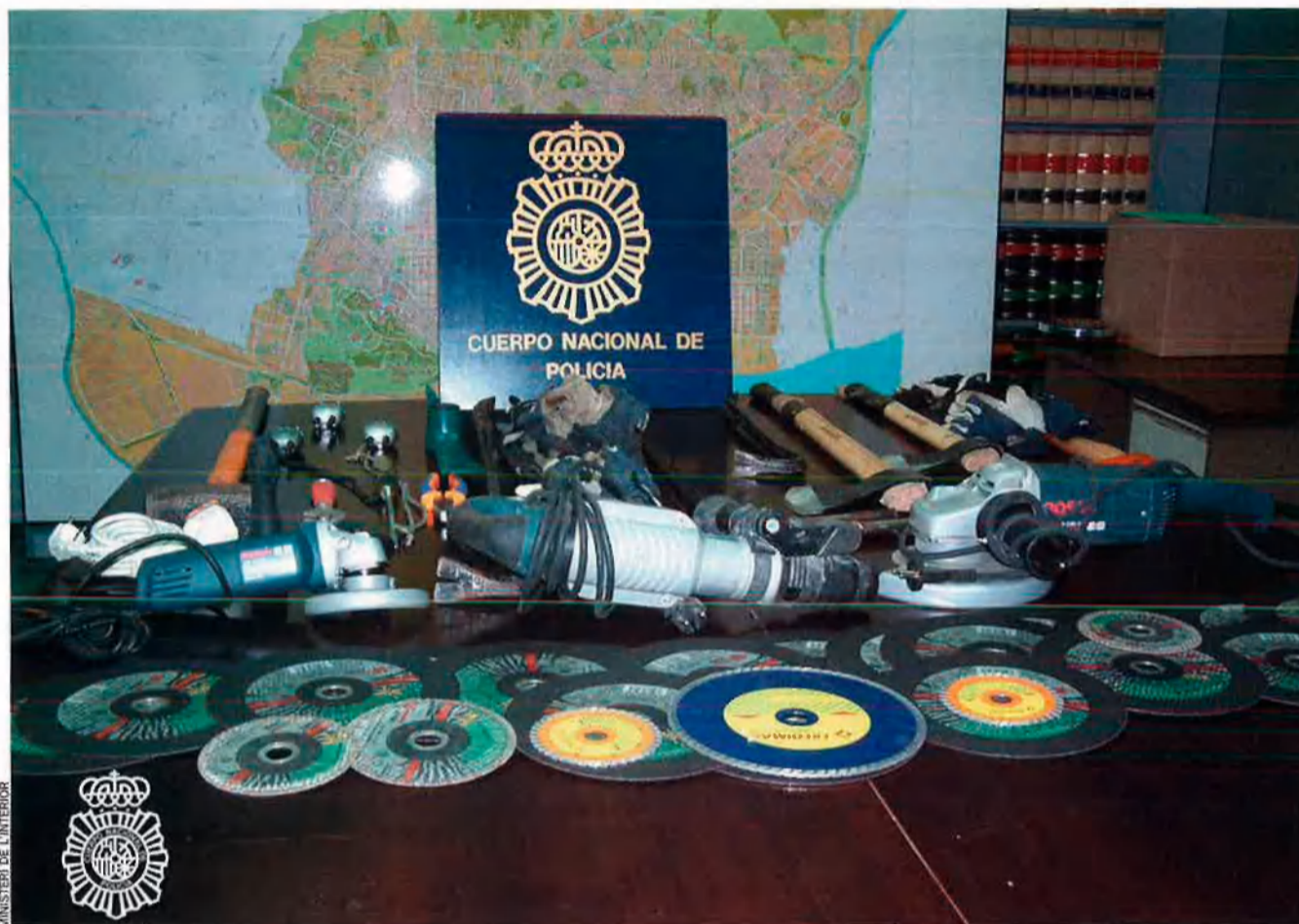
En l'operació San Fermín, les forces de seguretat van detenir cinc albanokosovars a Cerdanyola del Vallès. Havien comès setze robatoris pel procediment del butron al Vallès Oriental, Osona i el Maresme. Se'ls van confiscar destrals, malls, màquines radials i equips de transmissió.

riu de petits i expeditius grups delictius sense capos recognoscibles, proclius al camuflatge, a fer aliances de força i també a orientar les seues energies cap a la comissió de delictes diferents al narcotràfic.