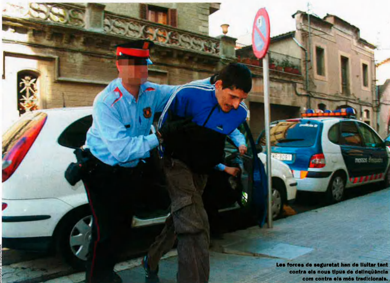
Les forces de seguretat han de lluitar tant contra els nous tipus de delinqüència com contra els més tradicionals.

H o reconeix un guàrdia civil que ha participat en la investigació —arreu de casa nostra— de les més estranyes variants de delictes violents, de crims: “El problema de seguretat principal i més quotidià que tenim avui són les noves bandes criminals, especialment les de l’Est d’Europa, ja que ara per ara no hi ha manera d’aturar definitivament la seua activitat.” Hi coincideix un càrrec policial valencià, amb una llarga carrera al darrere: “Si et carregues una d’aquestes màfies, l’endemà en tens una altra que la substitueix.” Segons diu, “la proliferació d’aquests delictes violents ha transformat la percepció que podíem tenir del crim com a negoci”.