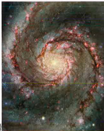
A dalt, el centre de la galàxia Remolí en una imatge del Telescopi Espacial Hubble. A sota, imatge presa pel COBE de la radiació de fons de l'univers, és a dir, l'energia que encara es troba a l'univers com a conseqüència del Big Bang.

Ordenació de les galàxies. Les galàxies a l'univers no es reparteixen de manera uniforme, sinó que s'agrupen en cúmuls i, al seu torn, aquests es reuneixen en supercúmuls. Aquestes agrupacions poden estar fins i tot connectades mitjançant filaments i nusos de galàxies que creen la imatge d'una retícula o una estructura esponjosa.