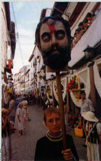
De sis en sis anys, durant el Sexenni, Morella també es fa bosc.

De sis en sis anys compta el temps Morella. Morellanes i morellans caminen, entre els secs perfils gòtics de muntanyes i cases, i van i tornen al bosc primigeni i obren de bat a bat la muralla per acollir la vivificant Vallivana, a fi de revitalitzar-se. Cada sis anys el santuari puja a la ciutat i es fa la festa; el forest entra en la ciutat i es fa la meravella. És al bosc sagrat de la vall màgica on habita, acaronada per guspireigs d'estels i murmuris de filets d'aigua, la verge mare Ivana, senyora d'una fèrtil cova —ventres generatrius, fructífers guals de vida sense fi— on raja una ubèrrima font. Diana —Djana i Joana—, deessa i donzella, regina dels boscos, amb una lluna als peus, senyal d'eternitat i de lluminositat, bessona del Sol que li regala la llum que vessa en les misterioses profunditats de la nit, resplendent protectora de fecunditats i naixements.