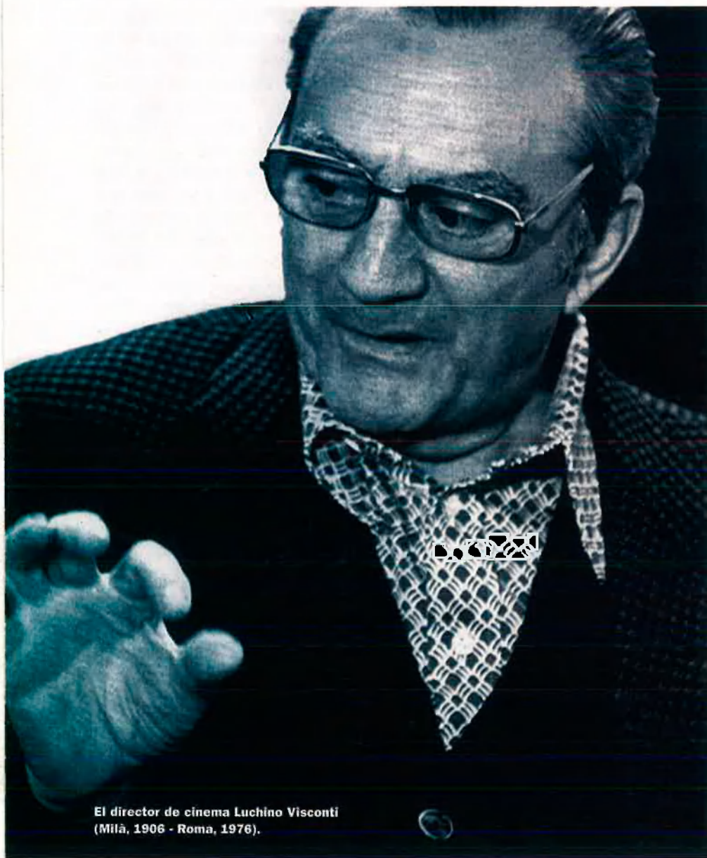
El director de cinema Luchino Visconti (Milà, 1906 - Roma, 1976).

Als quaranta anys de la seua mort i als cent del seu naixement, la figura i l'obra de Luchino Visconti recorre profundament una bona part de la història cinematogràfica i escènica del passat segle XX. Cinema, òpera i teatre tracen els tres eixos sobre els quals va construir una obra apassionada i convulsa que va obrir nous horitzons en el panorama artístic de la postguerra.