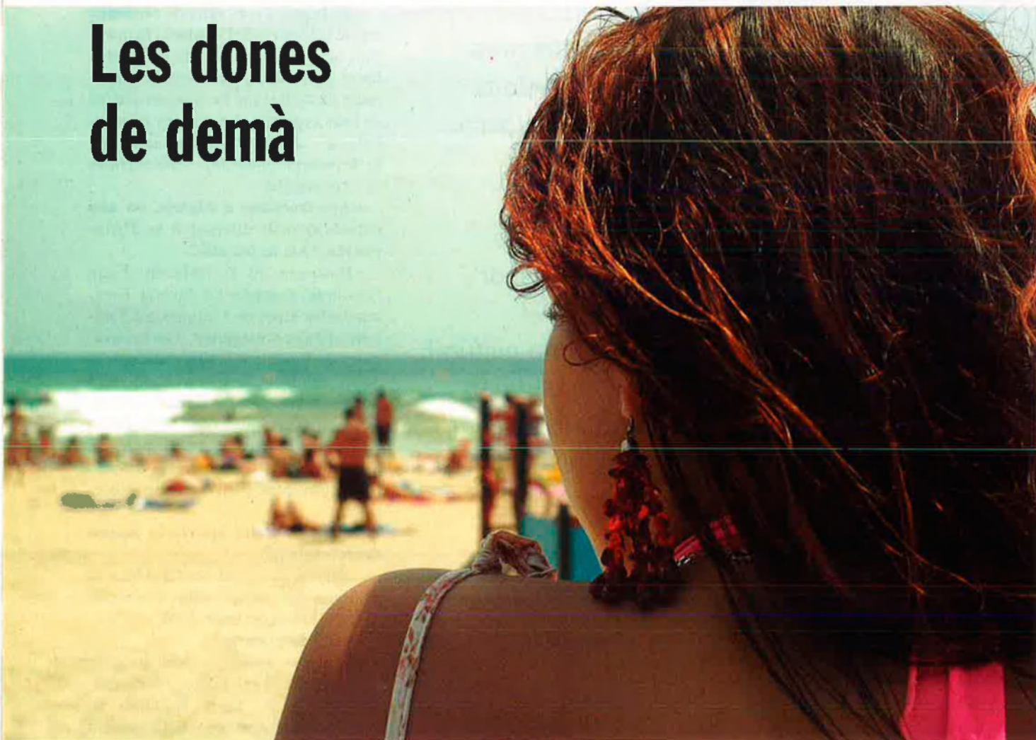
La platja, lloc habitual de reunió de la gent jove a l'estiu.

L adolescència és l'època en què la nena, que vivia feliç en la seua innocència, es veu sacsejada per tot un seguit de convulsions físiques i emocionals que l'alteraran durant els anys següents. Diu Woody Allen que es pot definir l'home modern com tot aquell nascut després de l'edicte de Nietzsche "Déu ha mort" i abans de l'è-