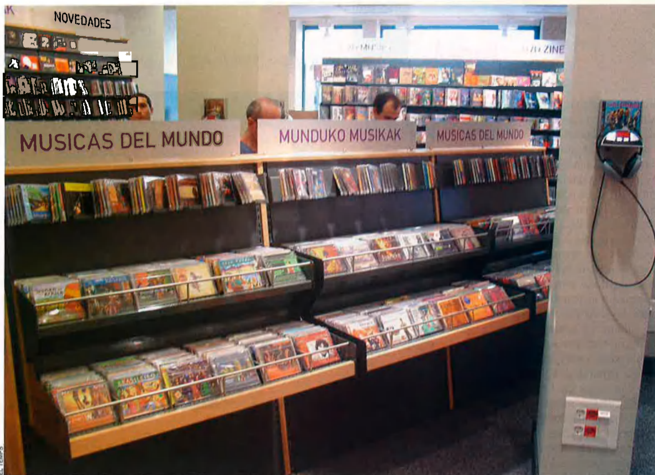
Una de les botigues d'Elkar, que ha aconseguit que la música basca rebri el mateix tracte que la forana.