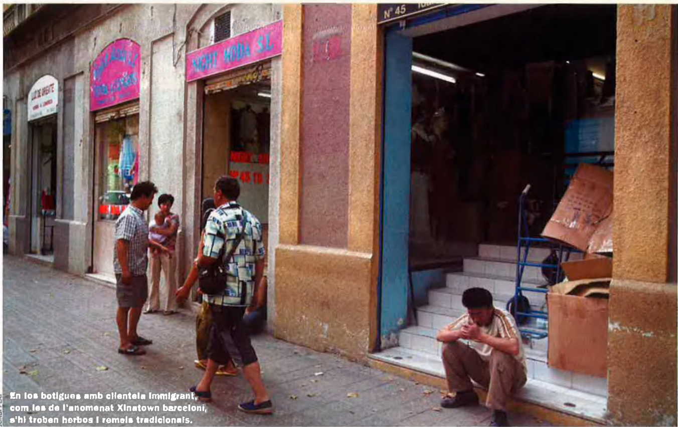
En les botigues amb clientela immigrant, com les de l'anomenat Xinatown barceloní, s'hi troben herbes i remeis tradicionals.