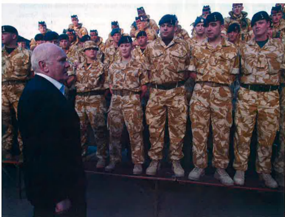
El secretari de Defensa britànic, John Reid (a l'esquerra), fa un discurs a les tropes britàniques destinades a Bagdad.

Holanda, República Txeca i Lituània, envaira l'Iraq, el president nord-americà encara no pot viatjar segur a la regió.