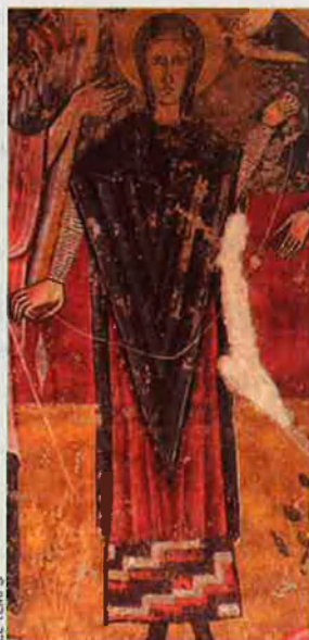
A sant Pere el prejubilaren sense miraments.

Regnà en les nostres mars, governà els nostres vaixells, senyoreja els sentiments dels nostres mariners. Potser, però, el mataren tant d'èxit, tal excés de popularitat. El cas és que a sant Pere el prejubilaren sense miraments. No li valgueren ni una llarga experiència, ni una formació professional aprovada, ni posseir llargues i poblades barbes, estris i, fins i tot, un bàcul –trident!– com Neptú, déu d'oceans i derivats, la qual cosa suposà, al principi, un gran estalvi en estàtues. L'aparell de l'estat espanyol fou implacable i, "por el justo derecho de conquista", la monarquia botiflera, nomenà, precisament la vespra de la seua festa, el 28 de juny de 1901, patrona de la marina la Maredeu del Carme; total per tenir oberta capella a Cadis; un ban de 12 de juliol de 1938 del tirà "bajito" reintroduí el patrocini, tot revocant les disposicions laiques republicanes; la