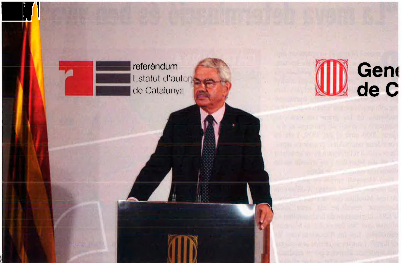
Pasqual Maragall va preferir realçar el seu paper institucional amb una celebració al Palau de la Generalitat. Des d'allà va considerar la victòria del sí com un pas endavant de dimensions històriques. També va adreçar –en castellà– un missatge tranquil·litzador a la ciutadania espanyola.

espanyola de marginació del Partit Popular. i la victòria del sí en el compte polític de Rodríguez Zapatero.